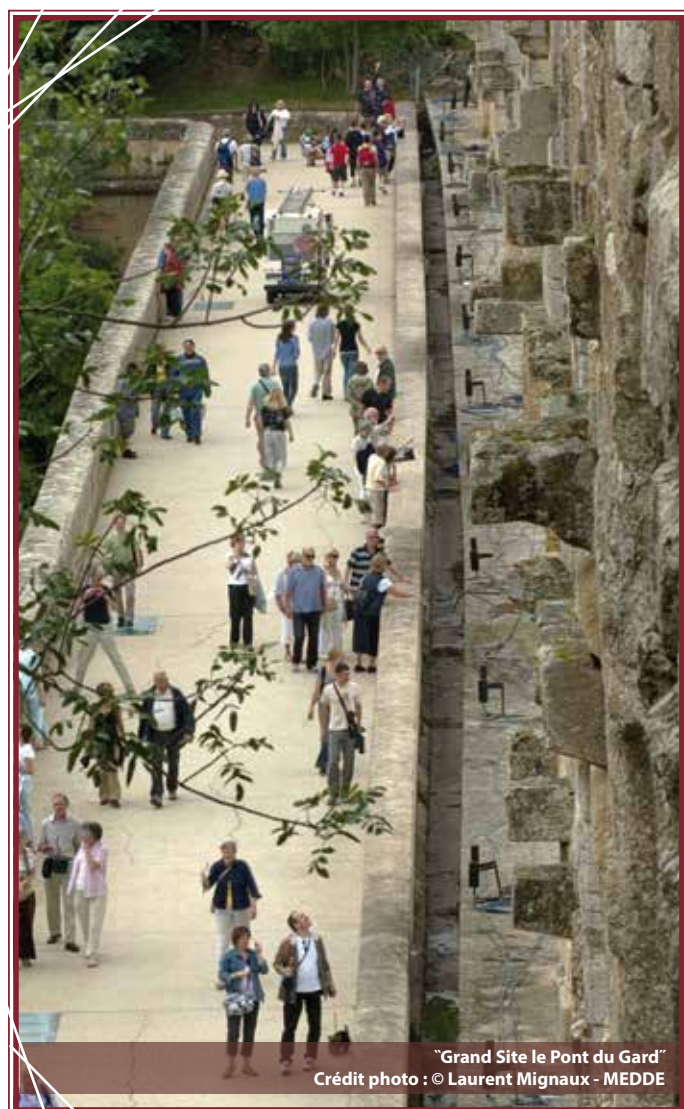
"Grand Site le Pont du Gard"