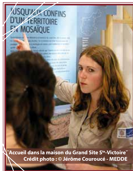
"Accueil dans la maison du Grand Site S te -Victoire"

Les nouvelles générations de touristes, rompus aux technologies modernes d'information et de communication via Internet, seront de plus en plus sélectifs sur la nature des prestations offertes, y compris en matière de comportement des professionnels à l'égard du développement durable et de la lutte contre le réchauffement climatique.