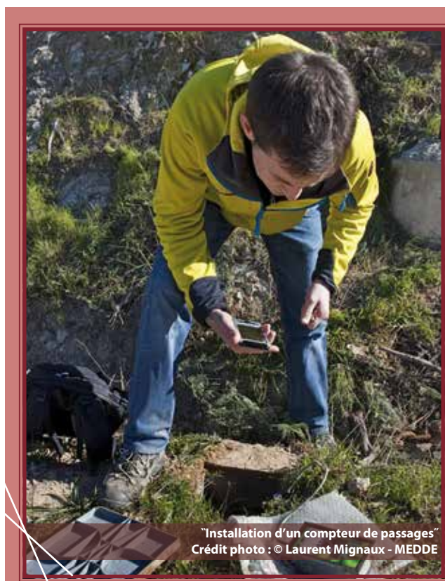
“Installation d'un compteur de passages”